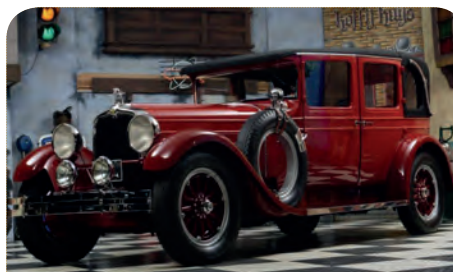
STUTZ VERTICAL EIGHT BROUGHAM