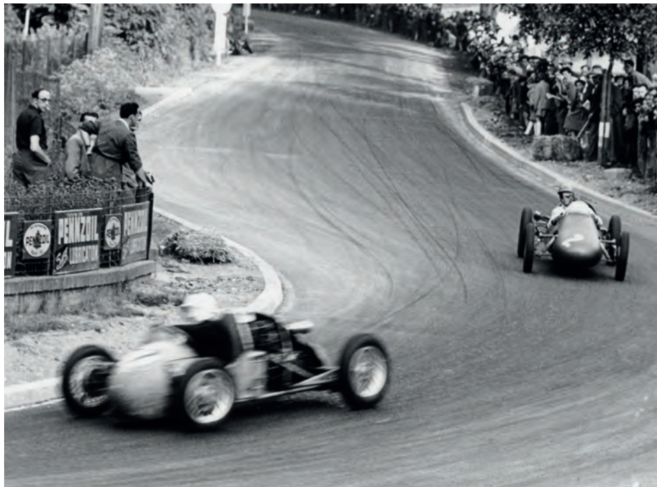
Stirling Moss, Peter Collins