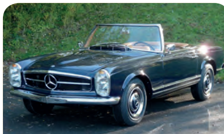
MERCEDES 230 SL PAGODE

L'Automobile Club Luxembourg en partenariat avec Luxauto.lu, vous accompagne également dans la vente et l'achat de véhicules dans la rubrique «ACL Véhicules Historiques» accessible depuis l'onglet «Loisirs» du site internet www.acl.lu .