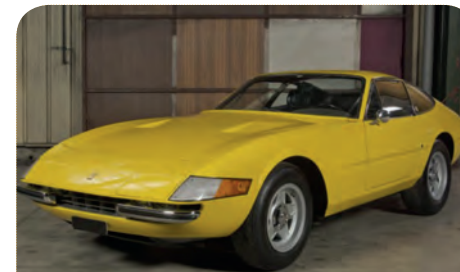
FERRARI 365 GTB/4